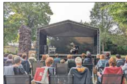
Archivfoto zur Krimilesung im Stadtpark Elsterwerda 2023

Mo. 10.00 – 16.00 Uhr Di. 12.00 – 19.00 Uhr Do. 10.00 – 12.00 + 13.00 – 18.00 Uhr