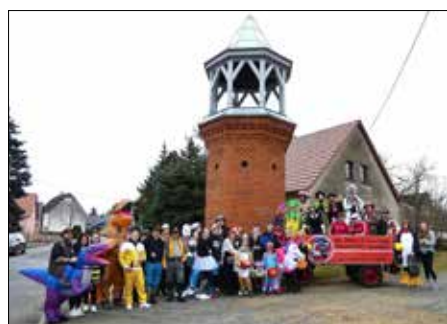
„Die bunte Zamper-Gesellschaft“

Dieses Jahr hatte die Zamper-Gesellschaft richtig Glück mit dem Wetter und so ging es bei angenehmen Temperaturen durch die Straßen von Kraupa. Mitglieder der Freiwilligen Feuerwehr und des Bürgervereins hatten sich fantasievoll verkleidet und mit dem eigens dafür umgedichteten Lied „Hurra, hurra die Feuerwehr ist da“ wurden von Haus zu Haus die Bewohner begrüßt.