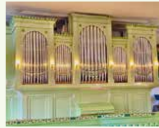
Außenansicht. Noch ist das Gehäuse in der Restauration.

Festgottesdienst und anschließender Empfang im Stadthaus Sonntag Jubilate, 21. April, um 10:00 Uhr in St. Catharina