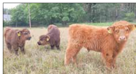
Der Highland-Nachwuchs fühlt sich sichtlich wohl