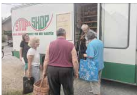
Die Treppe in den Bus ist beschwerlich – aber man hilft sich untereinander