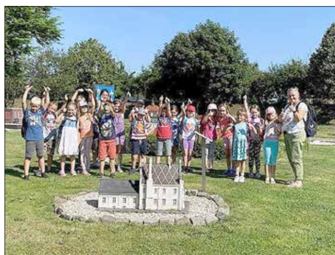
Kinder der Grundschule Hohenleipisch-Plessa mit ihrer Lehrerin