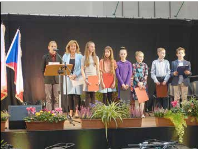
Kinder der Friedrich-Starke-Grundschule