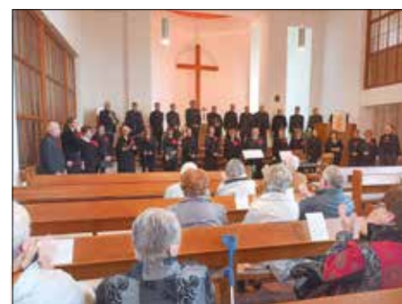
(Biehla, 30.04.2023)