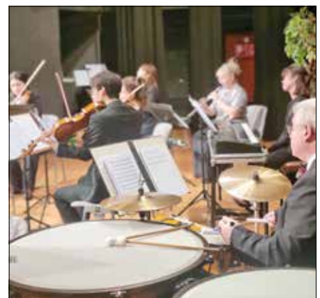
2025 BKE Neujahr