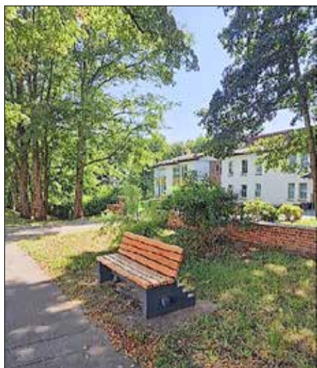
Berliner Str. Haus Winterberg Biehla, Spender Axel Falk