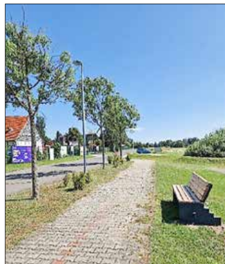
Miniaturenpark- Parkplatz, Spender Anja Heinrich