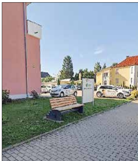
Ackerstraße vor Medis, Spender Handarbeitsclub Elsterwerda