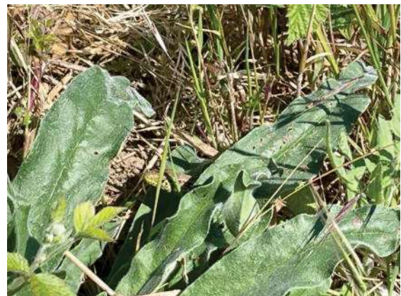
Foto 26: junges Männchen auf der Ostseite der Erdhaufen (11.41 Uhr)