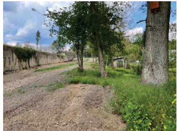
Foto 28: Bereich östlich des Bauwerkes Bewuchs zur Grundstücksgrenze