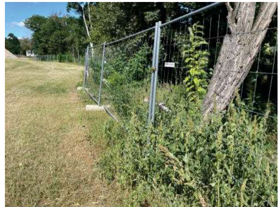
Foto 62: Flächen an der östlichen Grundstücksgrenze, Blick nach Norden