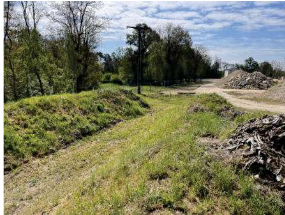
Fotos 15 und 16: Oberbodenhaufen an der nordöstlichen Ecke der Vorhabensfläche