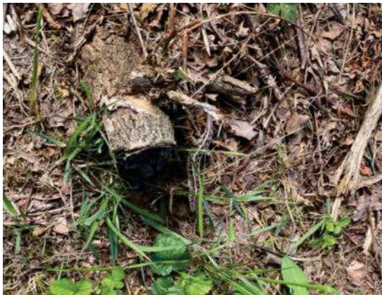
Foto 53: Alttier mit nachgewachsenem Schwanz südlich des Durchganges auf der Ostseite (15.03 Uhr)