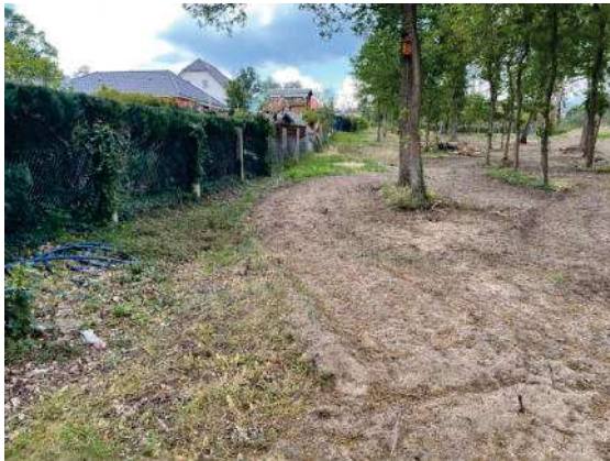
Foto 33: westliche Grundstücksgrenze mit waldbestandener Fläche ohne Bewuchs