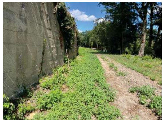
Foto 58: Bereich östlich des Bauwerkes altes Gleis, Blick nach Norden