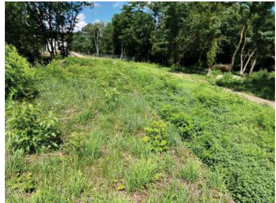
Foto 46: Blick vom Gleis zu den Flächen an der östlichen Grundstücksgrenze