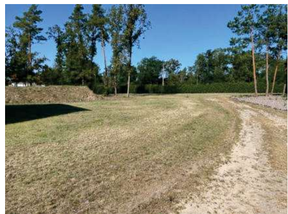
Foto 84: Blick zur nördlichen Wiese und Hecke, abgemäht und sehr trockener Zustand