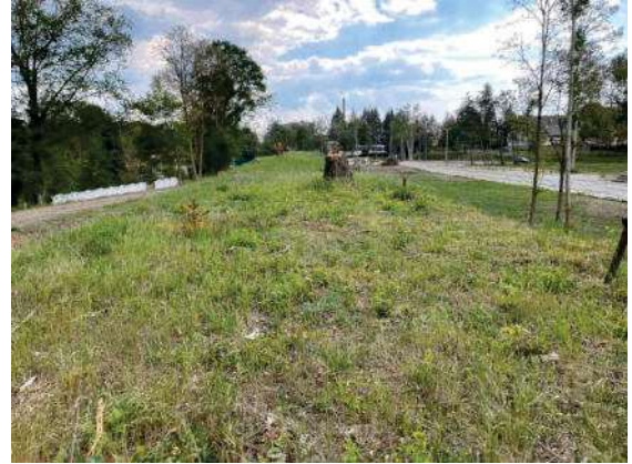
Foto 38: Detailansicht Fläche ehemaliges Bahngleis – spärliche Vegetation