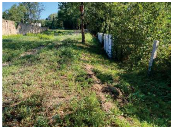
Foto 78: Bereich östlich des Bauwerkes altes Gleis, Blick nach Norden