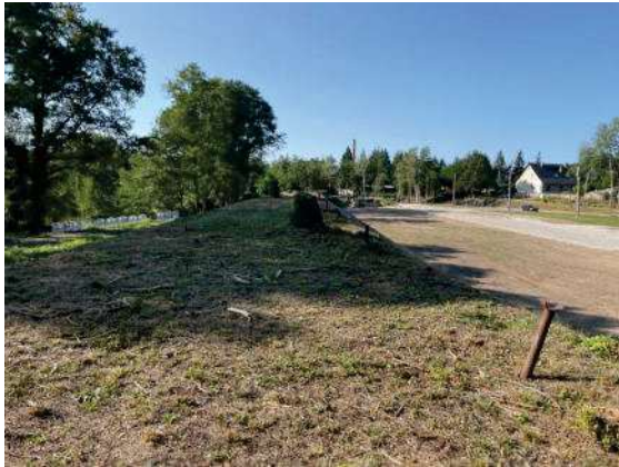
Foto 79: Flächen Bahngleis vollständig abgemäht, Blick nach Süden