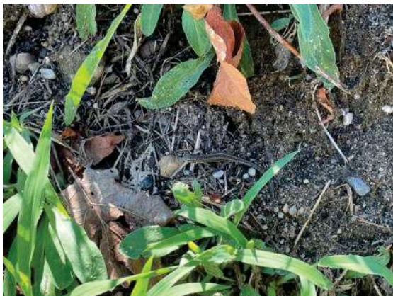
Foto 55: Jungtier vom letzten Jahr nördlich des Durchganges am Böschungsfuß Ostseite (15.22 Uhr)