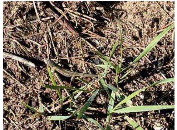
Foto 54: Jungtier vom letzten Jahr nördlich des Durchganges auf Böschungskrone (15.11 Uhr)