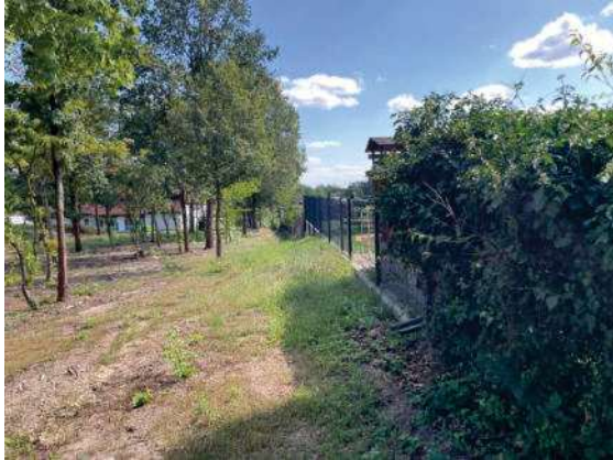
Foto 65: westliche Grundstücksgrenze mit angrenzendem Wäldchen, geringer Bewuchs