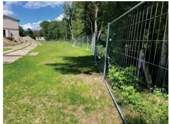
Foto 48: Flächen an der östlichen Grundstücksgrenze, Blick nach Norden