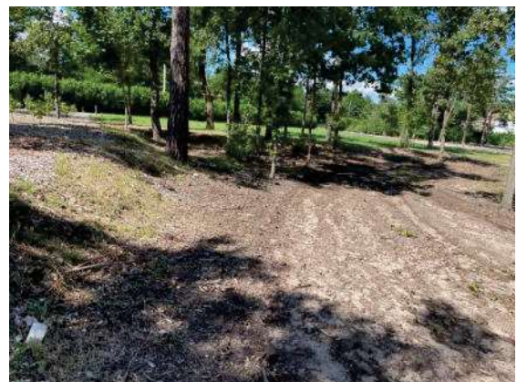
Foto 50: westliche Waldfläche ohne Unterwuchs im Norden die kurz gemähte Wiese vor der Hecke