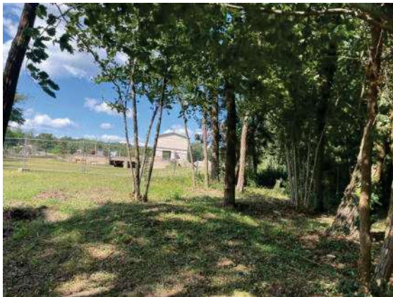
Foto 61: Waldfläche nördlich des Stubben-Walles, Blick nach Norden zu Bau-feld