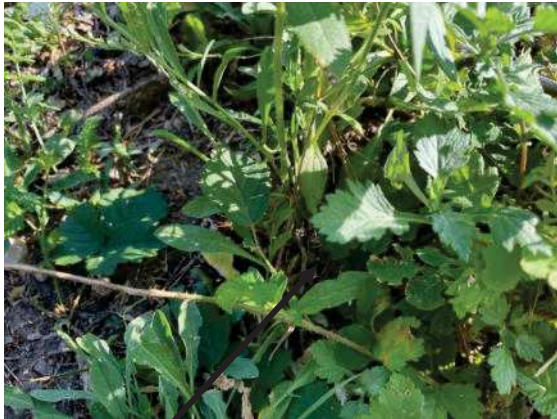
Foto 87: Jungtier Mitte Böschung, 15 m südlich Garagen (10.17 Uhr)