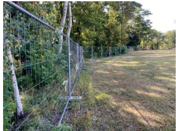
Foto 82: Flächen an der östlichen Grundstücksgrenze, Blick nach Süden