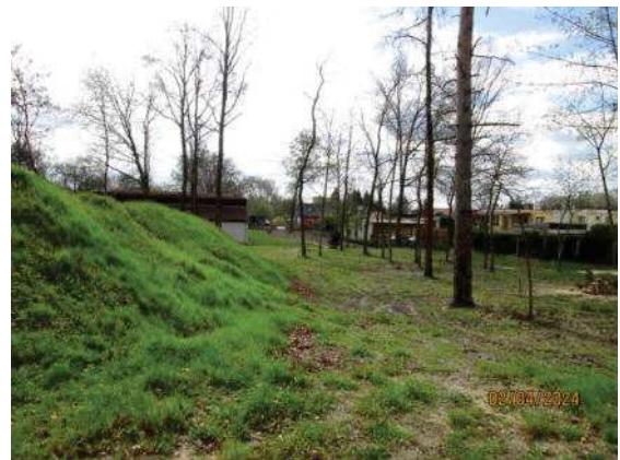
Fotos 7 und 8: waldbestandener Bereich an der Grundstückswestseite, am linken Bildrand jeweils die langgestreckten Erdhaufen in Nord-Süd-Richtung