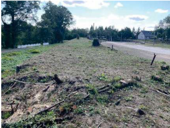
Foto 59: Flächen Bahngleis vollständig abgemäht, Blick nach Süden