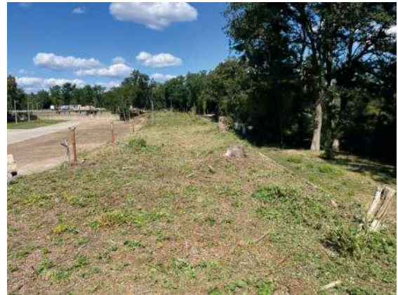
Foto 60: Flächen Bahngleis vollständig abgemäht, Blick nach Norden