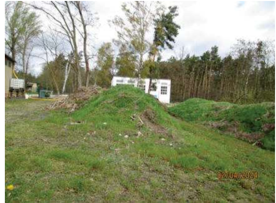
Fotos 5 und 6: Oberbodenhaufen an der nordöstlichen Ecke der Vorhabensfläche