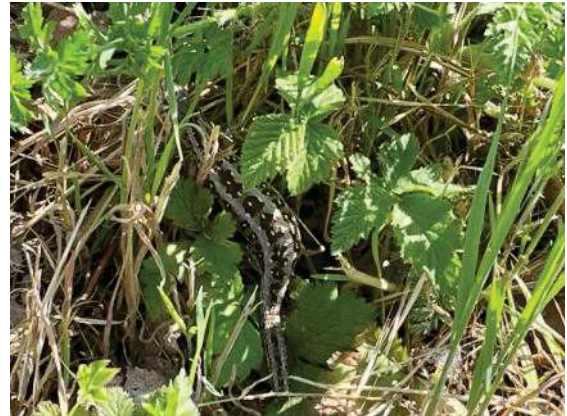
Foto 24: trächtiges Weibchen auf der Westseite der Erdhaufen (11.27 Uhr)