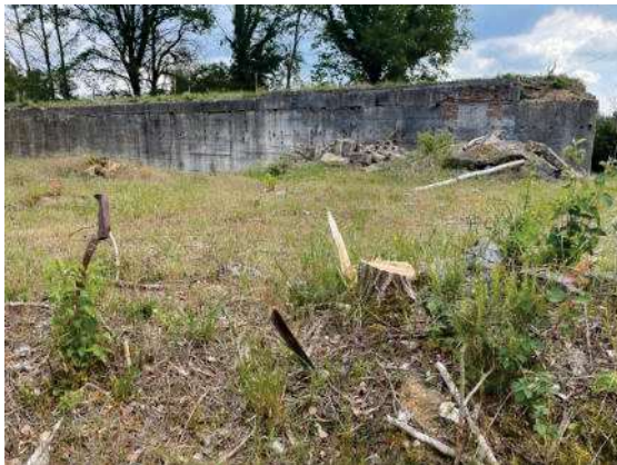
Foto 27: südliche Fläche mit Blick zum ehem. Gleis auf dem Bauwerk

Zustand der Flächen zum Zeitpunkt der Begehung