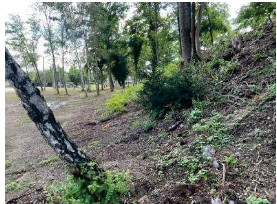
Foto 56: südliche Waldfläche, Blick nach Süden über die Böschung am Lutzweg