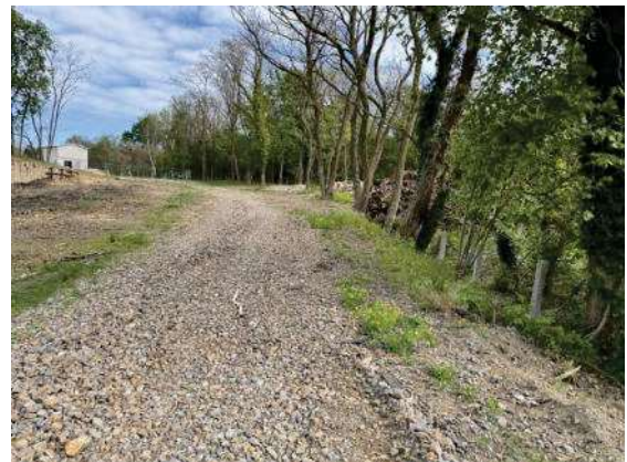
Foto 12: Bereich östlich des Bauwerkes altes Gleis kurz vor dem Stubbenwall