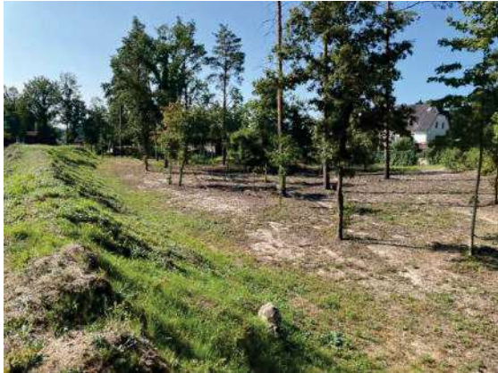
Foto 85: Blick vom Ende Erdhaufen zur waldbestandenene Fläche im Westen, geringer Bewuchs